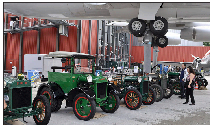
Stark vertreten sind die Modelle aus den frühen 30er-Jahren.