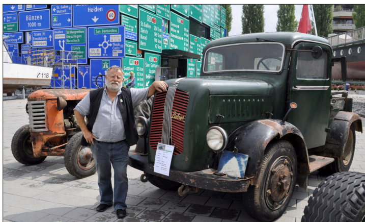
Auch das ist Bührer: Der Industrietraktor BSJ.