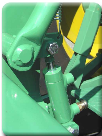
Die hydraulische Kippauslösung (Option)