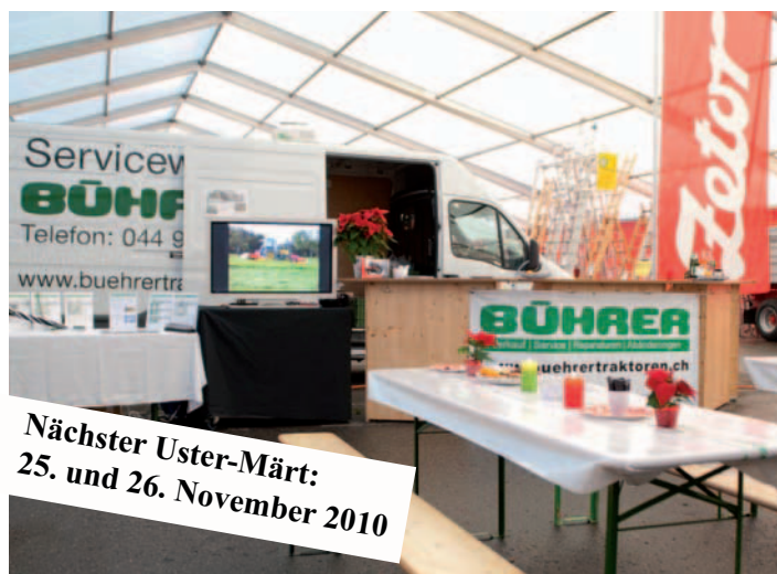
Zum ersten Mal zusammen - Bühner und Zetor

Wir möchten uns auch auf diesem Weg, bei allen Kunden, Fans, Freunden, Lieferanten, sowie allen Besuchern ganz herzlich für ihren Besuch an unserem Stand in Uster bedanken.