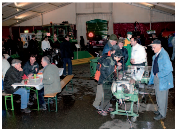
Das Tractospeed-Modell stösst immer wieder auf reges Interesse