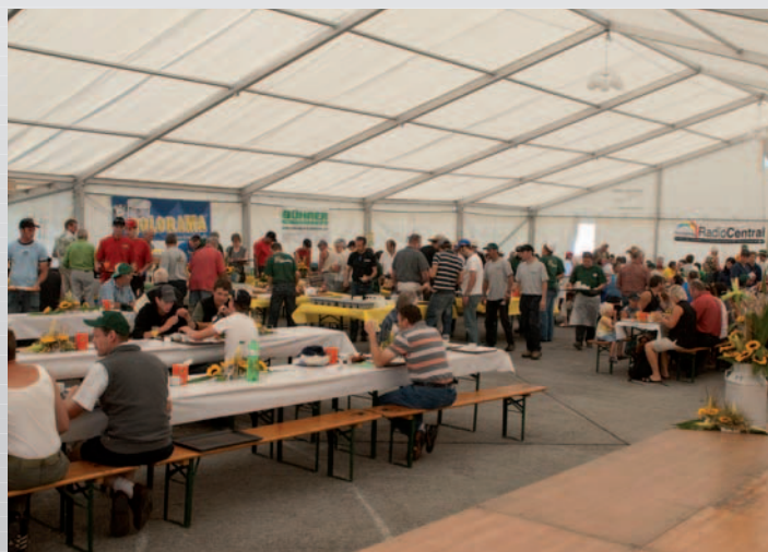
Grosser Andrang auf das Bühner-Zmorge-Bufferet

Neben feinem Bauernbrot und Gipfeli gab es allerhand Köstlichkeiten wie: Eier in allen Variationen, Aufschnitt, Speck, Schinken, Käse aus der Region, bis hin zum Müesli, Fruchtsäfte und vieles mehr. Die vielen Besucher gaben uns durch ihre Anwesenheit die Anerkennung, dass wir mit unserer Arbeit und unserem Engagement auf dem richtigen Weg sind.