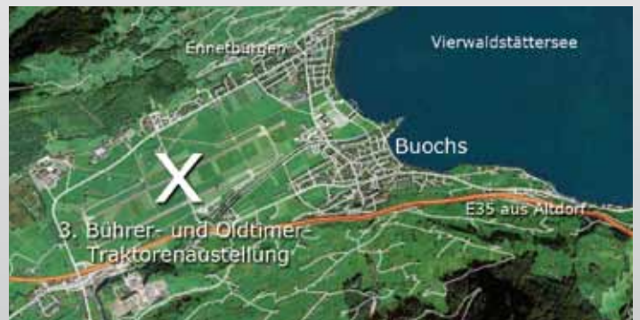
Lageplan der 3. Bühler- und Oldtimer-Traktorenausstellung in Buochs