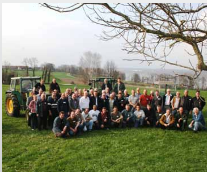
61 der ehemaligen Matzinger Mitarbeiter bei Ihrem Treffen