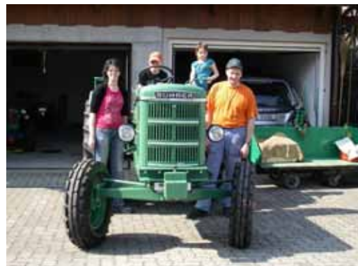
...persönlich übergeben werden zu können.