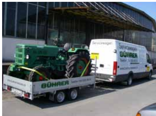
Der OP 17 wird transportiert, um danach...